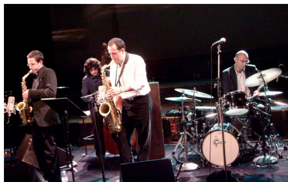
Concert à Radio France, le 11 mars 2006